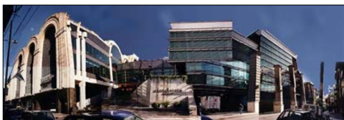
El colapso del orden post-urbano

Las principales metrópolis están atravesando una etapa de deconstrucción disciplinar de su viejo sistema urbanístico y en búsqueda de uno nuevo, debido a que las prácticas desarrolladas hasta aquí han comenzado a exhibir claros signos de su agotamiento. Desde esta perspectiva, no se han diseñado aún instrumentos que apunten a la organización espacial y funcional de la ciudad en sintonía con la complejidad de la nueva realidad emergente . Dado que en la materia se encuentra tanto por hacer y rehacer, esta circunstancia nos sitúa frente a una enorme oportunidad de futuro.