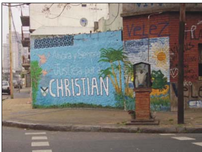
El culto urbano a la muerte trágica

Sin embargo, y a pesar de resultar posiciones encontradas, en todos los casos y por diferentes sendas se pretende alcanzar un mismo propósito: el esclarecimiento de las reglas de juego , qué es posible hacer, qué no, de qué modo hacerlo y bajo qué circunstancias encuadrarlo. Desde esta perspectiva, que emerja este tipo de tensiones extremas resulta muy interesante porque habla de un plan urbano agotado, que pone en evidencia la necesidad de pensar colectivamente un nuevo escenario de crecimiento.