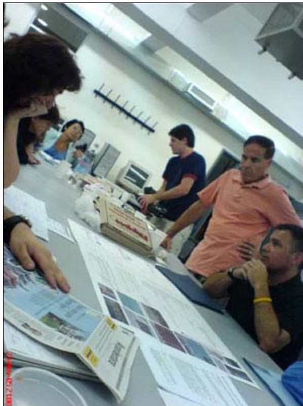
Proceso de formulación de diagnóstico y propuestas: sobre la mesa de trabajo, diferentes integrantes del proyecto (especialistas, funcionarios, vecinos, estudiantes) dan cuenta de los avances generados y participan de los procesos de diagnosis y formulación de propuestas para el área de Abasto.

- Estrategias de recuperación: la crisis por la que atraviesa el área en los centros históricos compromete la calidad del hábitat. Con lo cual, se requieren políticas y programas que promuevan la renovación urbana, la destugurización, la recuperación ambiental, la seguridad ciudadana, la generación de oportunidades de empleo, la participación vecinal y ciudadana, el fomento de los vínculos de solidaridad y reciprocidad entre los diversos actores, y la consolidación de los espacios multiétnicos y pluriculturales que hacen a los centros ámbitos vivos abiertos a la creatividad y diversidad.