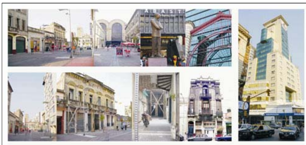
Imágenes del área de Abasto, Buenos Aires

Transcurridos siete años de aquella crisis institucional surgen en el campo cultural argentino nuevas interpretaciones vinculadas a la actualidad del concepto espacio público , en medio de su recurrente aparición en primer plano, tanto por los efectos de la divulgación de las acciones de renovación de aceras, embellecimiento y vallado de áreas verdes (la elevación del concepto a la figura de ministerio en el gobierno local es otro dato relevante, así como las numerosas programaciones de actividades culturales al aire libre).