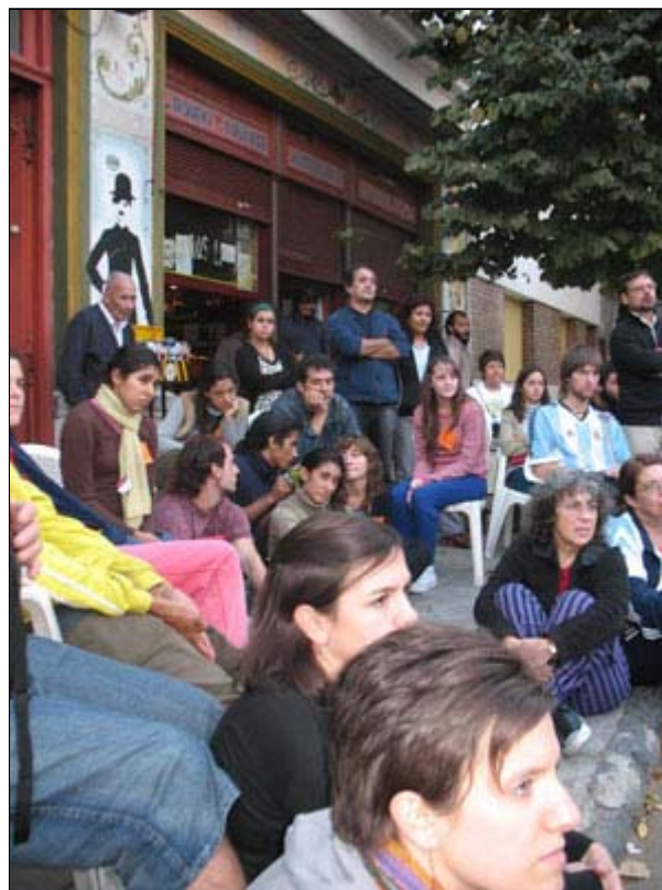
Jornada de debate en el "Parque Social Abasto"

Desde esta perspectiva, el proyecto del Parque se instala como herramienta capaz de aportar una posibilidad efectiva de articulación social y de reconfiguración urbana. Dado que se trata de un sistema abierto e inclusivo, representa de la manera más horizontal posible las relaciones entre los diferentes actores sociales por fuera de estructuras jerárquicas . Esta figura, que expone su confianza en la sociedad civil, aspira a construir una política de la ciudadanía para comprender un escenario transformador con sus propios medios.