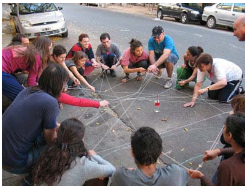
Los juegos callejeros en el "Parque Social Abasto"

Seguidamente, se trabaja sobre aquellas iniciativas que aún no cuentan con financiamiento cierto, a fin de encauzar su grado de factibilidad. Eso está ocurriendo en concreto con el proyecto de un circuito teatral (una experiencia de teatro callejero a lo largo del barrio), desarrollado de manera conjunta entre una compañía de teatro independiente y empresarios del sector turístico; que está en la búsqueda de una línea de subsidios del área de cultura del Gobierno de la Ciudad. De todos modos, la mayoría de los proyectos en marcha prevén su autofinanciamiento .