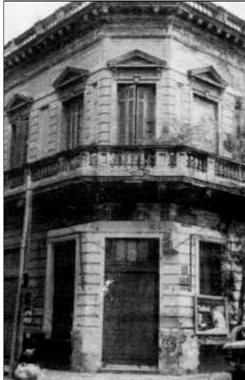
El demolido Bar O`Rondeman, en Abasto.

En consecuencia, surgen como principales problemas a resolver en Abasto los siguientes: